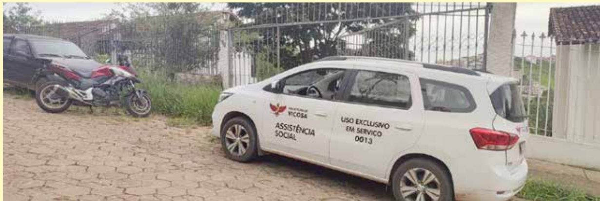
Dias antes de ser resgatada, vizinhos já haviam acionado as autoridades para denunciar os maus tratos sofrido pela idosa que morava com seu neto chileno