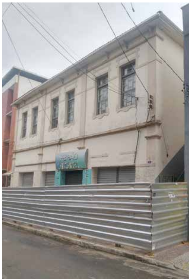
O destino do casarão continua indefinido e os pedestres sem onde passar

O que a maioria questionava na ocasião era que, no caso de eventual queda do casarão, não somente as pessoas que estivessem passando pela calçada corriam riscos, mas os carros, motos e bicicletas na