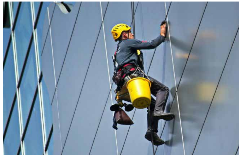
Em outubro, mais de 170 pessoas foram demitidas de suas funções relacionadas a serviços de manutenção e zeladoria de edifícios

Araponga é a cidade da microrregião de Viçosa com o pior desem-