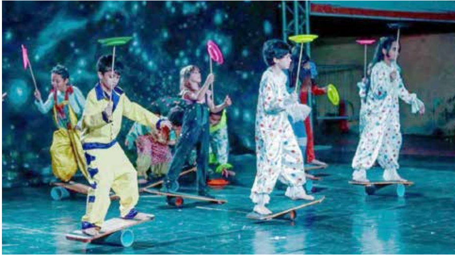
Arte, entrega e resistência marcam a performance dos alunos durante a mostra anual do Centro Experimental de Artes de 2022

Na área das danças, crianças e jovens do balé, das danças urbanas, do passinho e do jazz funk, desde as turmas iniciantes, até as mais avançadas, hipnotizaram a plateia com seus movimentos dinâmicos e expressivos.