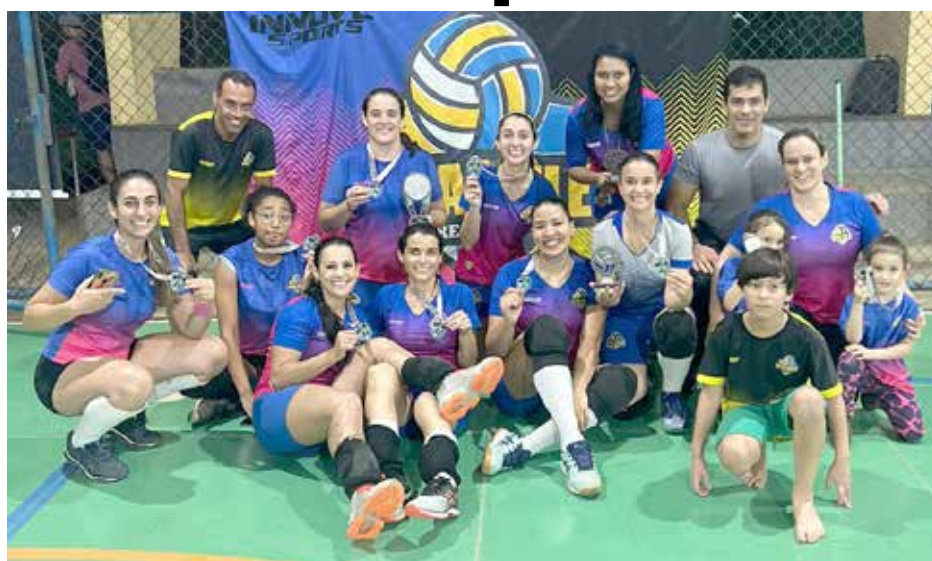
Garra e determinação não faltaram às meninas do Viva Vôlei em Ubá