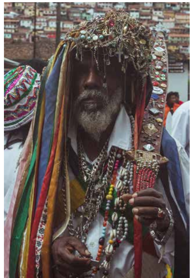
A exposição Congoé esteve em cartaz na Pinacoteca da UFV em 2021

O resultado, com os nomes dos artistas selecionados será divulgado no dia 27 de janeiro. Todos os detalhes estão disponíveis no site da Pinacoteca da UFV. Dúvidas podem ser esclarecidas pelo e-mail pinacoteca@ufv.br, com o assunto: "Edital de exposição na Pinacoteca da UFV", ou