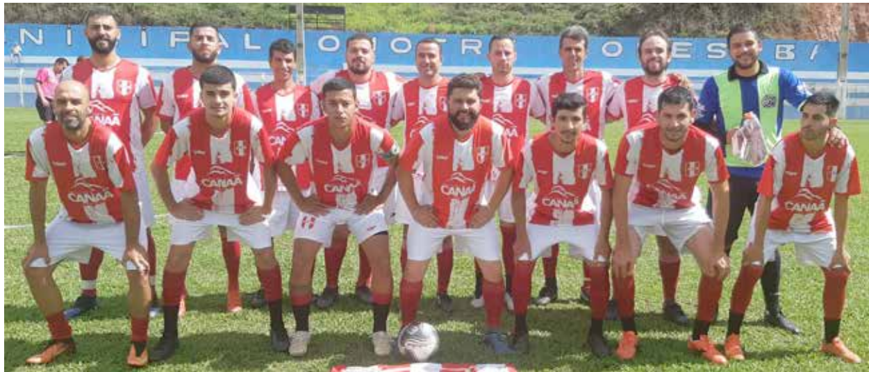
Sem sofrer derrota no Municipal de Canaã, até agora, o PRM é a equipe de melhor aproveitamento técnico de toda a competição. A decisão deverá ser uma grande festa

Dois jogos, na tarde do último domingo, 4, em Canaã, definiram as duas equipes que vão fazer a grande final do Campeonato Municipal de Futebol, promovido pela prefeitura da cidade.