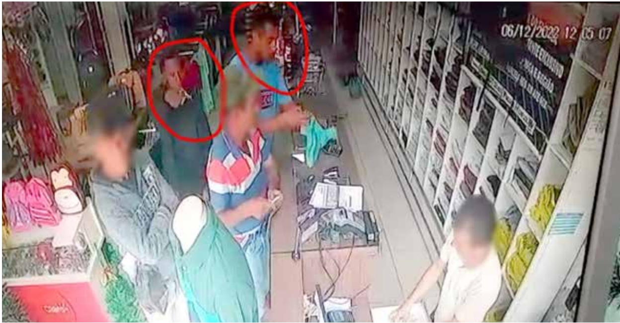
De “cara limpa”, os dois assaltantes, usando revólveres, renderam clientes e funcionário da loja

foi descrito como um homem moreno escuro, magro, de estatura mediana, que trajava blusa preta e calça escura, enquanto o outro era parto, magro e alto, e vestia camisa azul e calça escura. Eles roubaram aproximadamente R$ 4 mil e fugiram em uma motocicleta Honda vermelha, e fugiram por uma estrada de chão, seguindo rumo a Canaã.