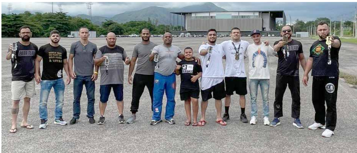
Os atletas do jiu-jitsu de Viçosa se reuniram para a última prova internacional de 2022. O desempenho foi considerado satisfatório

Foi disputado, nos últimos dias 26 e 27 de novembro, na Arena da Juventude, em Deodoro, no Rio de Janeiro, O Word Cup de Jiu-jitsu, promovido pela CBJJO (Confederação Brasileira de Jiu-jitsu Olímpico). Representando a GFteam de Viçosa, participaram do evento internacional alguns atletas da Academia Paiva Team de Jiu-jitsu.