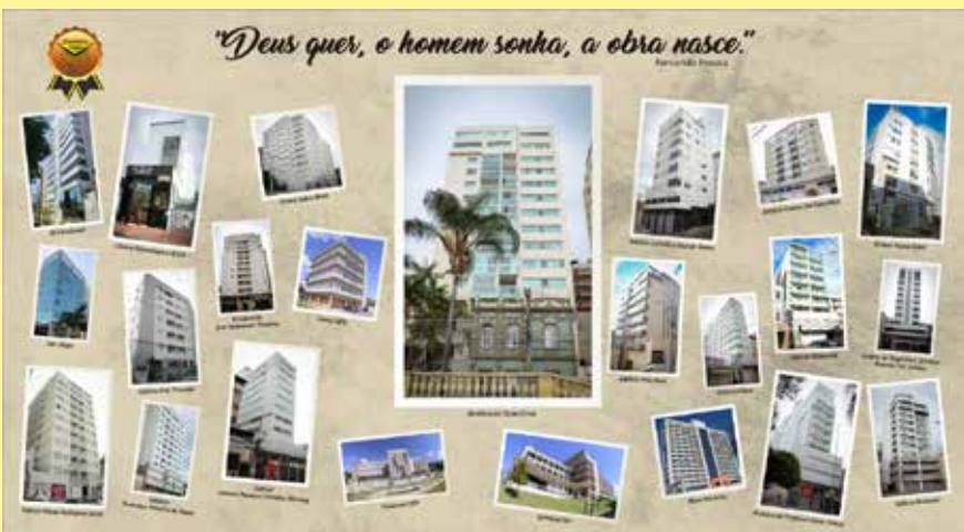
Projetos executados pela Triunfo em Viçosa e região

Há 25 anos a Esquadrias e Vidraçaria Triunfo é referência em qualidade. No último sábado, 3, nossa empresa foi homenageada pela Casa do Empresário de Viçosa. Dividimos essa conquista com nossos colaboradores, clientes e amigos. A todos, nosso muito obrigado!