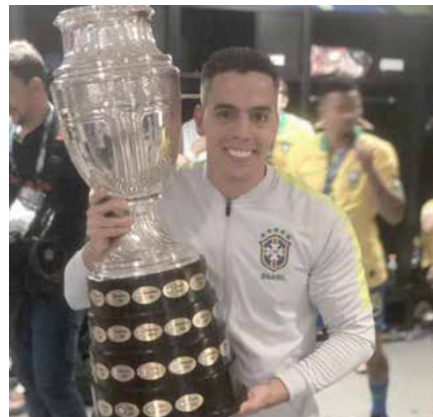
Guilherme e o troféu de Campeão da Copa América 2019

quando eu vim para BH fazer faculdade. Foi um caminho longo e com muitas dificuldades, abdicando muitas vezes de estar com a família e com os amigos, mas graças a Deus hoje posso dizer que tudo valeu a pena! Agora vamos buscar esse Hexa, se Deus quiser”.