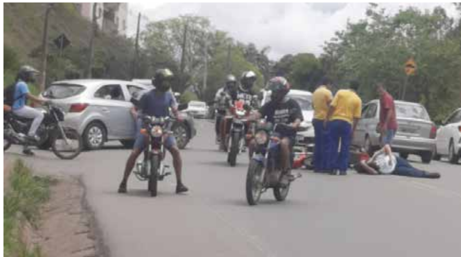
Tanto no entroncamento com a rua Tiradentes (acima), quanto no do Bar do Edilson (abaixo), motocicletas colidiram em carros e feriram seus condutores