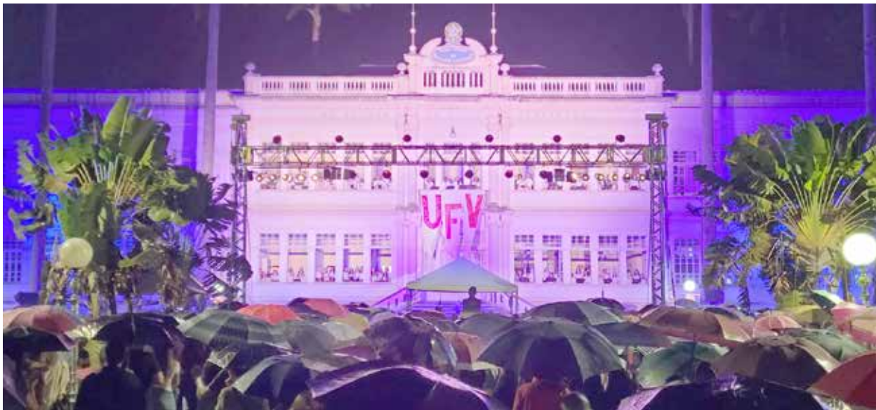
Nas divulgações do evento, a organização recomendou que o público levasse banquinhos para maior conforto. Mas, para garantir a tradição, o público também se municiou de guarda-chuvas e marcou presença

O tempo chuvoso do último domingo, 4, não ofuscou o brilho da Cantata de Natal realizada no edifício Arthur Bernardes na UFV (Universidade Federal de Viçosa). “As chuvas já viraram marca da Cantata. Das 10 que eu dirigi, apenas três não foram com chuvas. Com isso, o público já leva seu guarda-chuva e sempre tem público. Agora o retorno presencial foi muito importante, afinal, o presencial é sempre mais importante e mais impactante que o virtual. E mais, as relações interpessoais “ao vivo são muito melhores dos que atrás de uma telinha”. E, se pensarmos que tantas pessoas tiveram e têm problemas por conta deste distanciamento social, então o retorno se