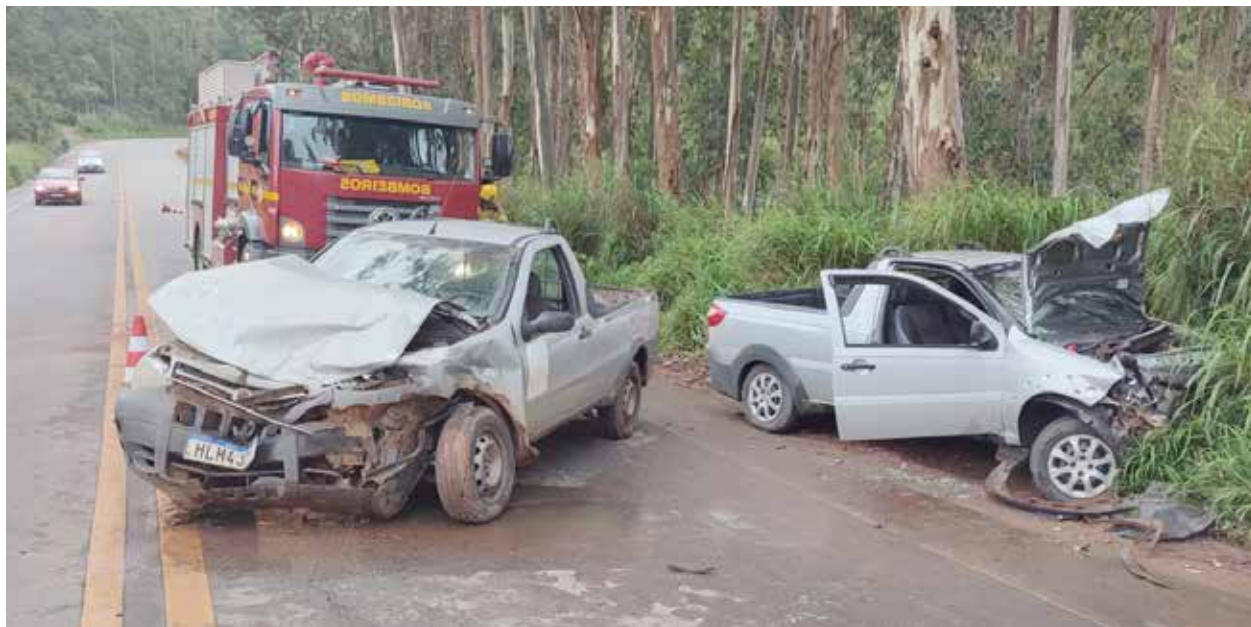
Uma das caminhonetes atravessou a pista, causando o grave acidente

Os veículos, devidamente regularizados, foram liberados depois que o local foi periciado por um profissional da Polícia Civil de Viçosa.