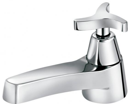
TORNEIRA DE MESA CROMADA PARA BANHEIRO DOCOL TRIO 500906