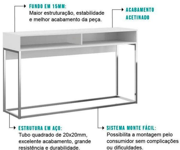
APARADOR BRANCO COM ÉS METÁLICOS PARA COPA SECA