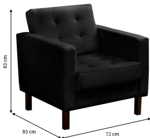
POLTRONA ISADORA MOBLY EM COURINO PRETO