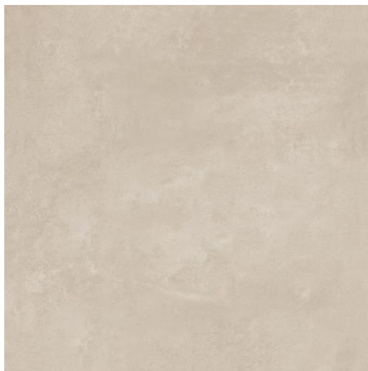
PORCELANATO ACETINADO RETIFICADO TRIBECA BEIGE SATIN 90X90, BIANCOGRÊS

Fotos ilustrativas dos materiais e móveis especificados: