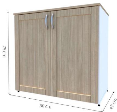
MÓVEL DE APOIO EM NOGUEIRA