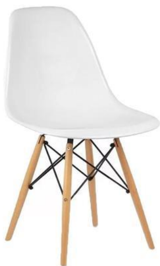
CADEIRAS EAMES BRANCA