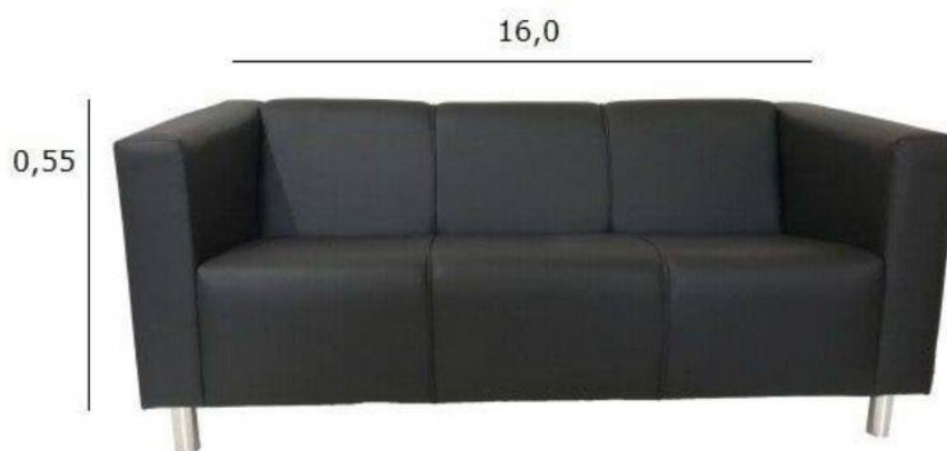
SOFÁ 03 LUGARES NILO MOBLY EM COURINO PRETO