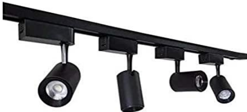
TRILHO ELETRIFICADO PRETO 2M, COM 05 SPOTS