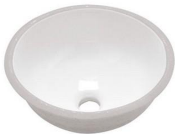
CUBA DE EMBUTIR BRANCA REDONDA 36CM