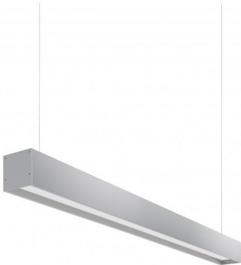
PENDENTE RETANGULAR SOBRE AS MESAS DE DIRETORIAS