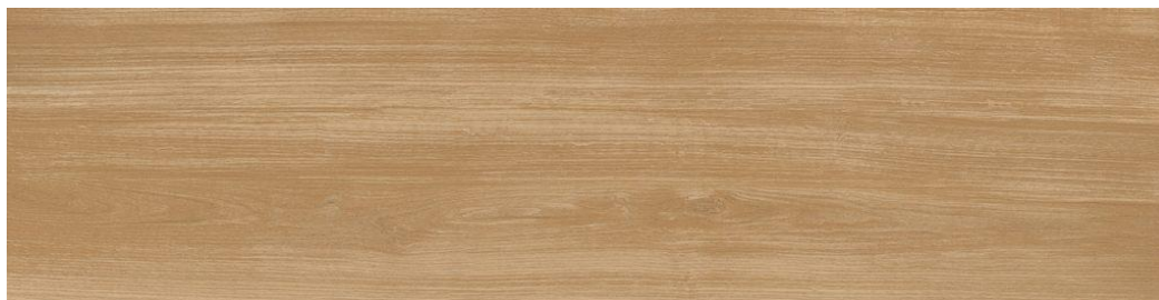
PORCELANATO ACETINADO RETIFICADO LEGNO DORATO 26X106, BIANCOGRÊS