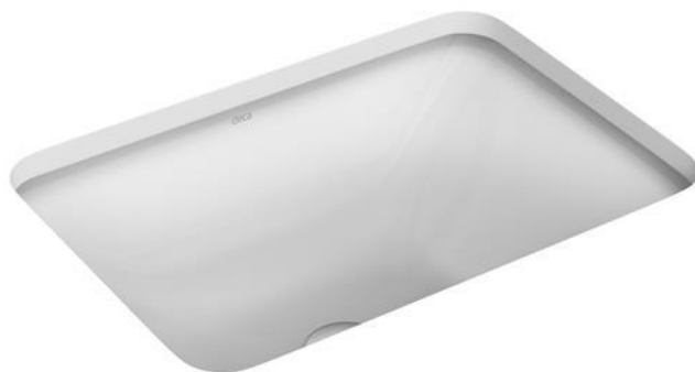
CUBA DE EMBUTIR BRANCA DECA L 37517 RETANGULAR