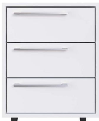
GAVETEIRO BRANCO PARA BALCÃO DA RECEPÇÃO