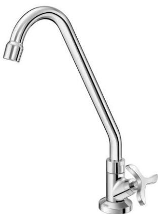
TORNEIRA DE MESA CROMADA PARA COZINHA DOCOL NOVA PERTUTTI