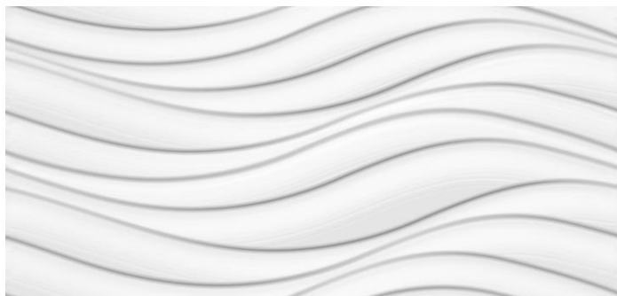
REVESTIMENTO CERÂMICO RETIFICADO NUANCE BRILHANTE 91X43,5, CEUSA